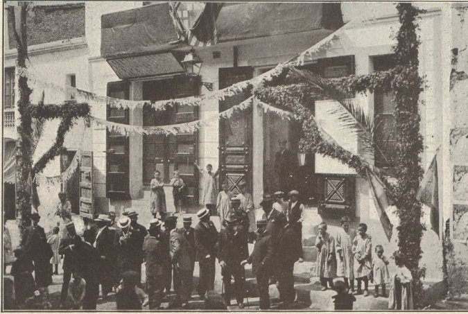
Llegada de los diputados a las Casas Consistoriales de Arenys de Munt

ce mos de francés-español y español francés por la suma copiosísima de palabras de una y otra lengua que contiene, por la precisión de sus versiones y por el sistema rigurosamente científico que ha precedido á su confección.