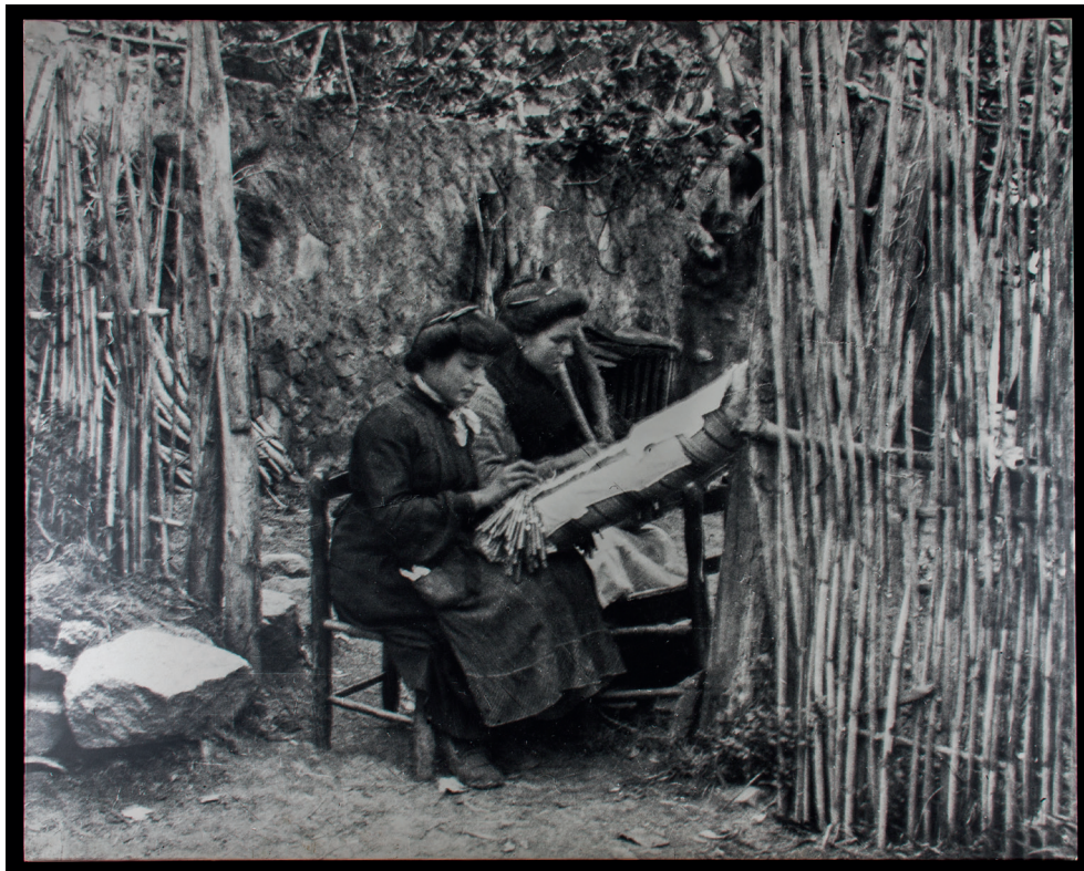
Foto: Adolf Mas , 1906 Institut Amatller de l'Art Hispànic. Arxiu Mas