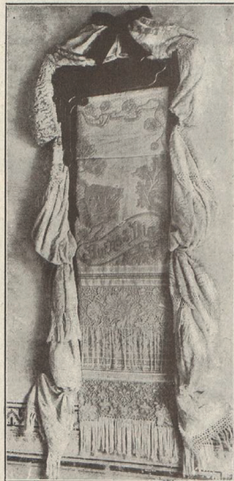
Instalación de la casa Vda. de P. Guasch y Presas Tohalls, rizos y encajes

Los visitantes recorrieron todos los locales y admiraron y