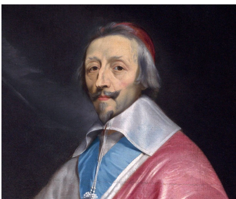
Detall del Retrat del Cardenal Richelieu, Philippe de Champaigne. National Gallery Londres