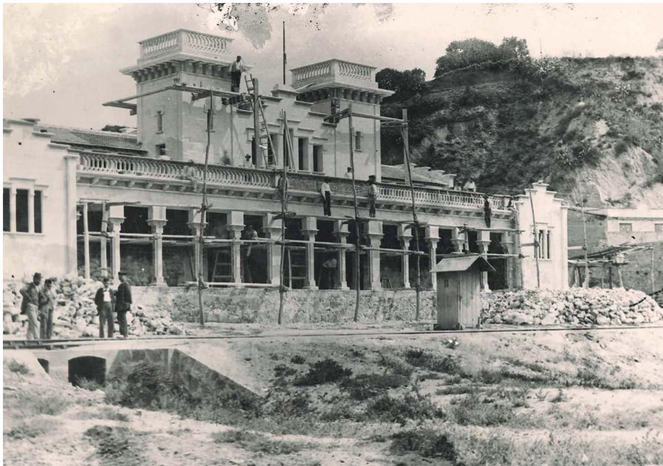
Balneari Lloveras en construcció. 1890-99.