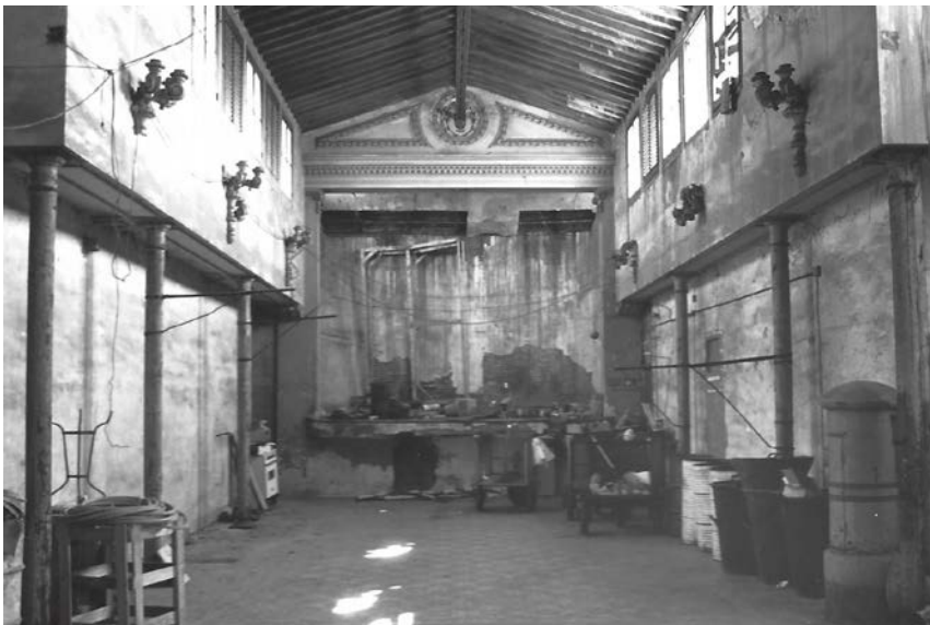
Sala d'espectacles del Balneari Lloveras reconvertida en magatzem municipal. 1982.