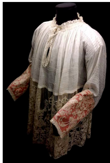
Roquete para la Capilla de San Jorge. Casa Castells de Arenys de Mar, 1929-1930. Lino blanco, encaje de ret fi realizado con bolillos. Barcelona, Palau de la Generalitat de Catalunya, Departament de la Presidència

Durante diez meses, las mejores encajeras de Arenys de Munt confeccionaron con finísimo lino alemán de la mejor calidad estos seis metros de encajes, que se presentaron la festividad de San Jorge de 1928. La técnica utilizada, como no podía ser otra, fue el ret fi, tradicional técnica de encaje fino que se realiza en la comarca del Maresme desde el siglo XVIII.