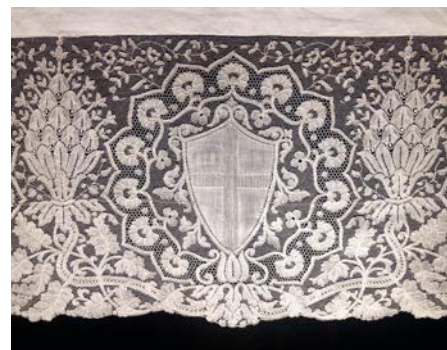
Mantel de altar de la Capilla de San Jorge. Casa Castells de Arenys de Mar, 1927-1928. Lino blanco, encaje de ret fi realizado con bolillos. Barcelona, Palau de la Generalitat de Catalunya, Departament de la Presidència