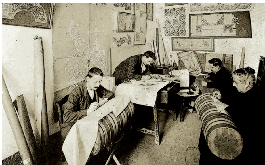
El taller de la Casa Castells.