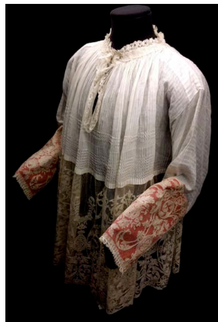
Roquet per a la Capella de Sant Jordi. Casa Castells d'Arenys de Mar, 1929-1930. Lli blanc, punta de ret fi realitzada amb boxets. Barcelona, Palau de la Generalitat de Catalunya, Departament de la Presidència

d'Arenys de Munt van confeccionar amb finíssim lli alemany de la millor qualitat aquests sis metres de puntes, estrenades la diada de Sant Jordi de 1928. La tècnica emprada, com no podia ser altra, va ser el ret fi , tradicional punta fina treballada en els dos Arenys des del segle XVIII.