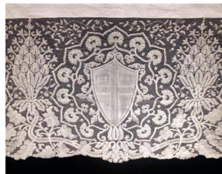
Estovalles d'altar de la Capella de Sant Jordi. Casa Castells d'Arenys de Mar, 1927-1928. Lli blanc, punta de ret fi realitzada amb boxets. Barcelona, Palau de la Generalitat de Catalunya, Departament de la Presidència