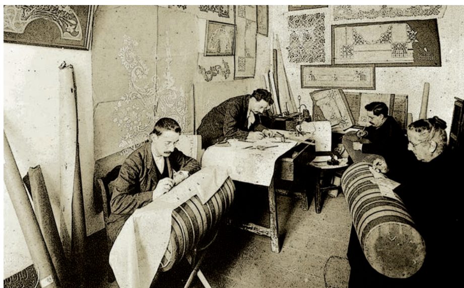
El taller de la Casa Castells.