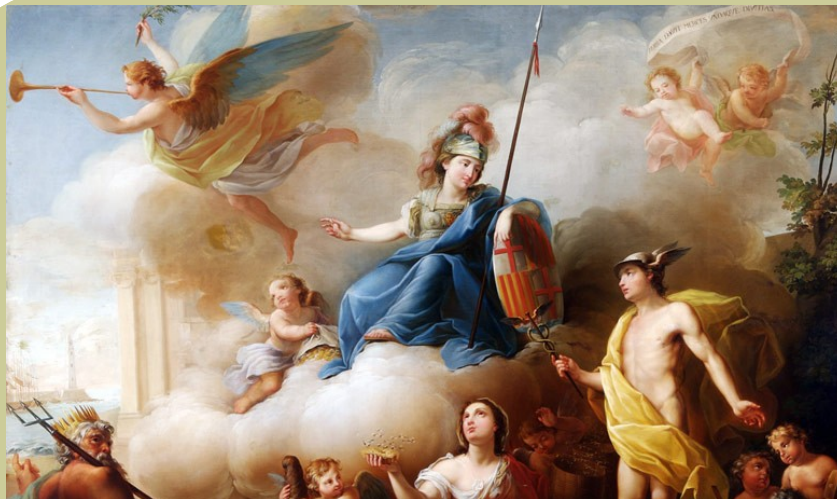
La Junta de Comerç, protectora del port de Barcelona. Pere Paul Muntanya. 1802