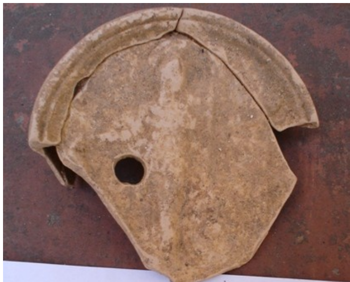
Llàntia del jaciment de Valldemaria, Arenys de Mar, Segle I aC, núm.reg 9387

Les llànties estaven formades pel dipòsit de combustible que en època romana era oli d'oliva, la coberta que tenia forma cònca. A la part